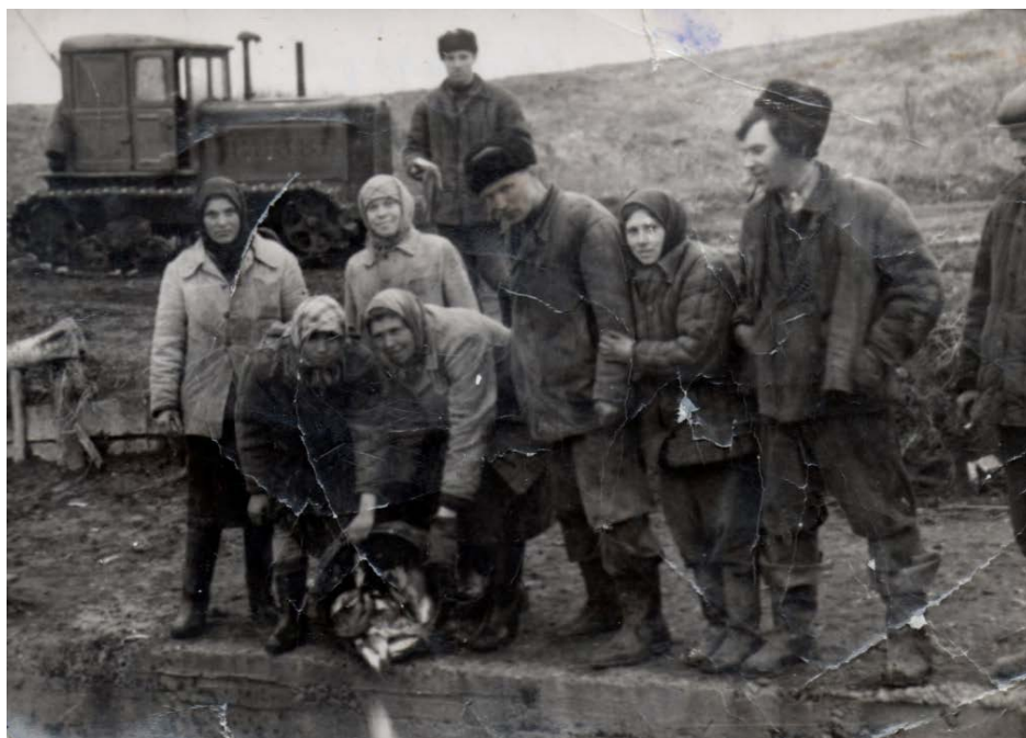
Рыбхоз, 1961 год

В 1959 году начал функционировать рыбхоз «Ураевский».