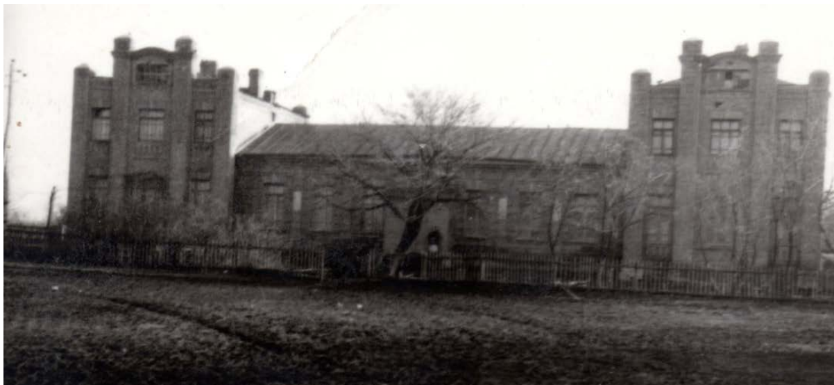
Здание Ураевской школы, 1970 год

1962 год – Ураевская семилетняя школа была реорганизована в восьмилетнюю.