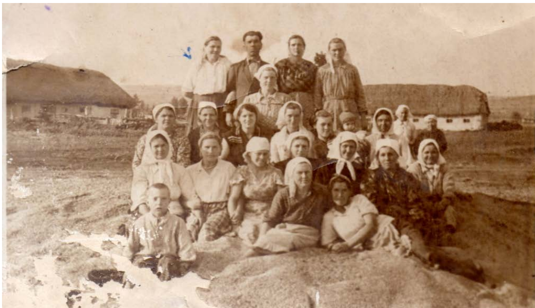
На току, 1955 год, из арх. Н.Н. Макетрук

До 1958 года поля Ураевского колхоза им. Калинина обрабатывала Уразовская МТС. После реорганизации МТС колхозу им. Калинина была передана часть техники.