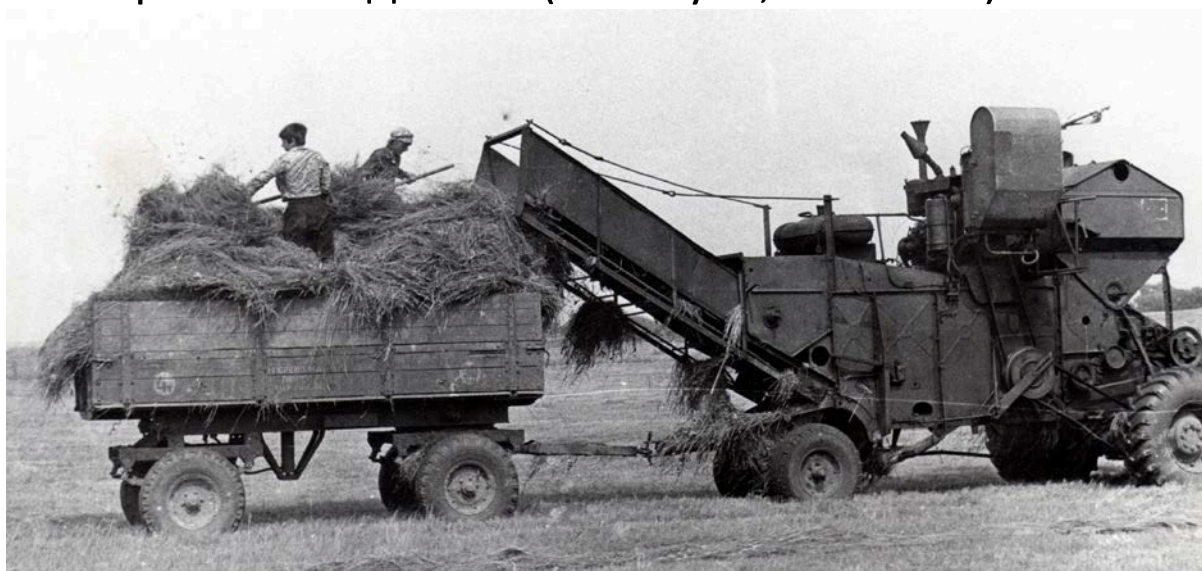
1966 год

В декабре 1962 года Уразовский район «ликвидировали», и Ураево перешло в состав Валуйского района. По данным переписей населения в с. Ураево на 17 января 1979 год – 623 жителя, на 12 января 1989 год – 461 (198 муж., 263 жен.). 4