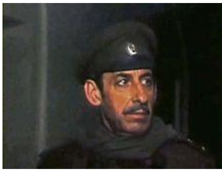
Владимир Басов в роли Мышлаевского в фильме «Дни Турбинных».