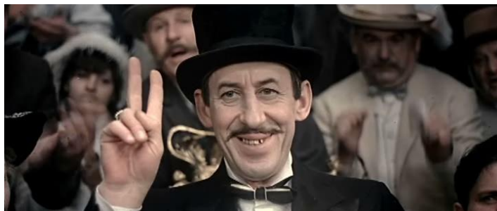
Владимир Басов в фильме «Бег» (1970 г.).

обстоятельствам"), героических лентах ("Братушка", "Срочно... Секретно... Губчека").