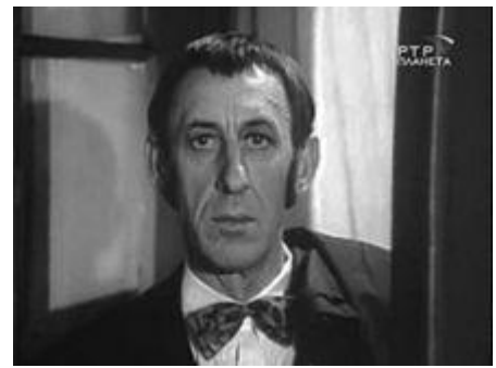
Владимир Басов в роли Стэнтона в фильме «Опасный поворот».

Его появления на экране, за редким исключением, были краткими, секундными, но всегда "выстреливали" в десятку. Первым таким стопроцентным попаданием в цель стала роль полотёра в фильме "Я шагаю по Москве". Возник этот персонаж случайно. В фильме не было критического отношения к жизни, модного в то время. Это отметили многие критики еще до выхода картины, разругали сценарий, так что роль недовольного всем полотера пришлось сочинять буквально на ходу в разгар съемок. Случайно по студии проходил Владимир Басов, его попросили помочь сыграть эпизод, и Басов согласился. Таким образом, в кино пришел выдающийся комический артист.